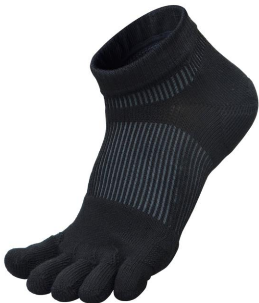
5本指のスポーツソックス