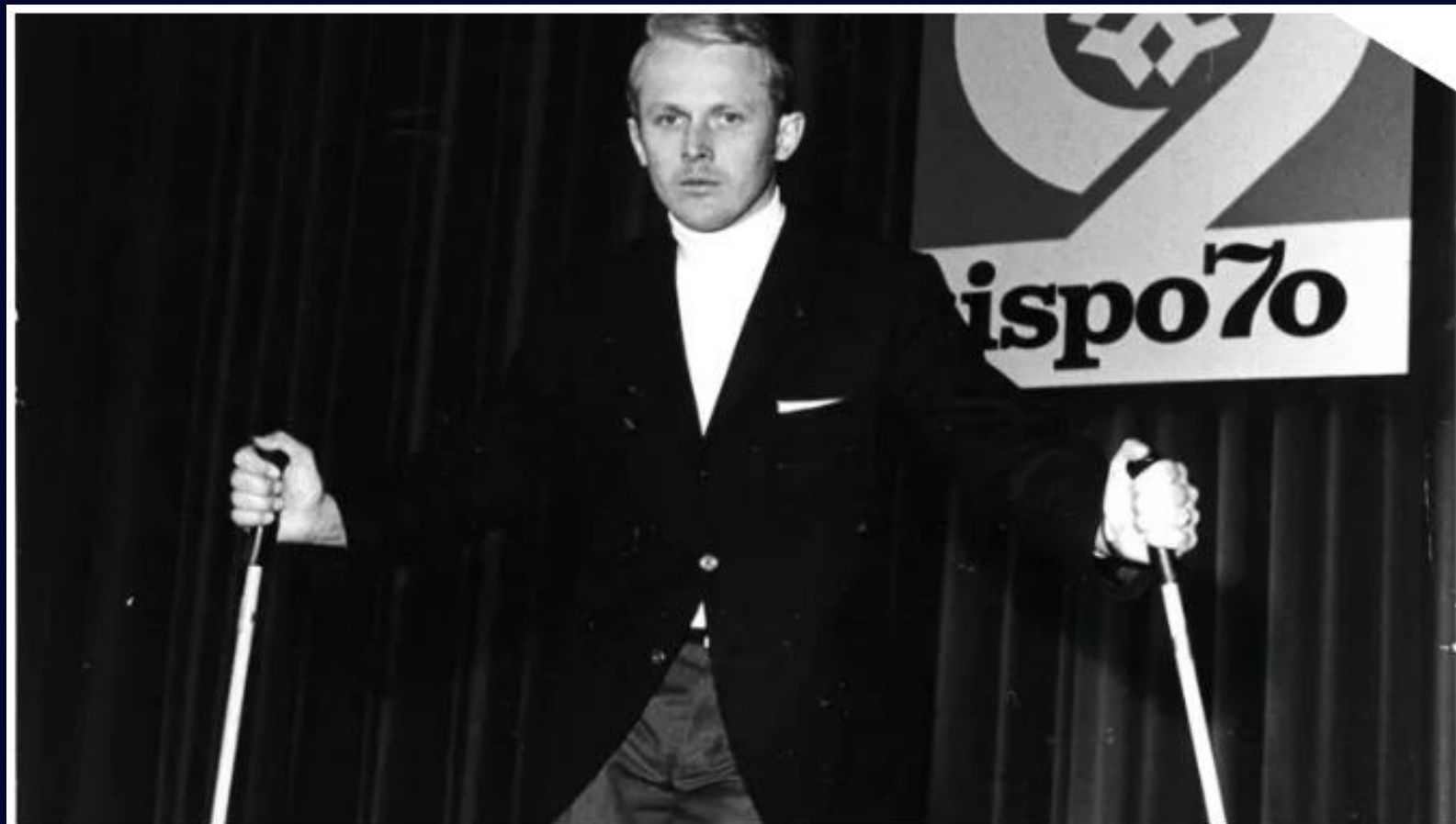
ISPO Munich opens its doors on 8 March 1970.