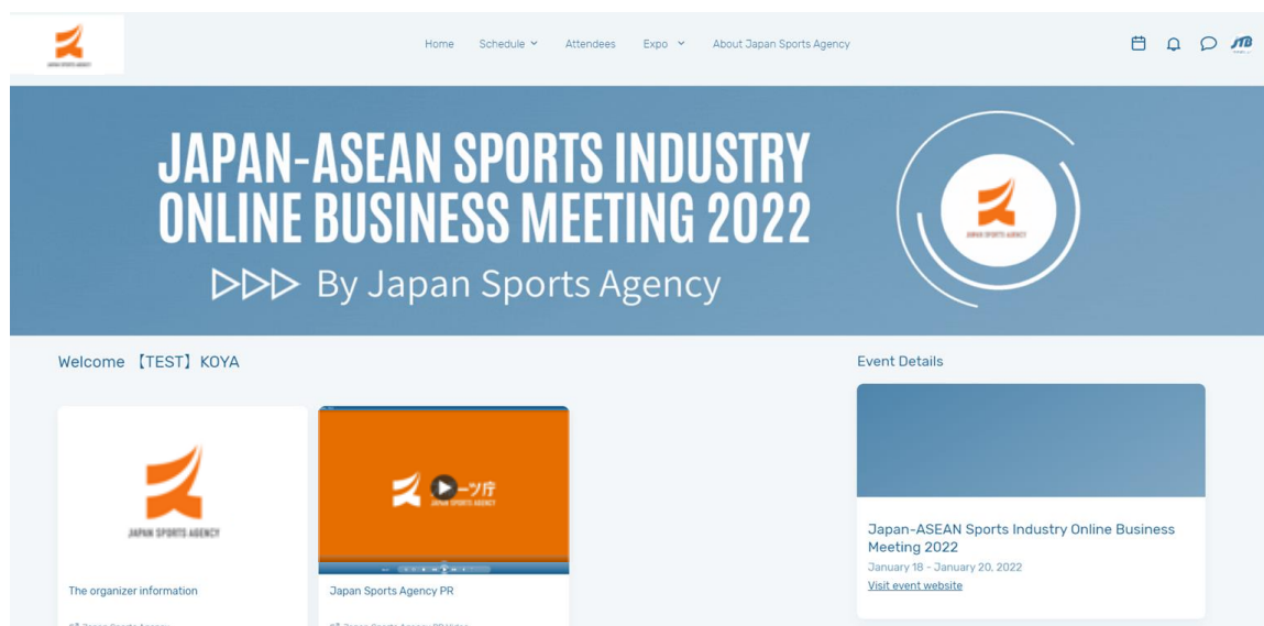
※トップページ イメージ